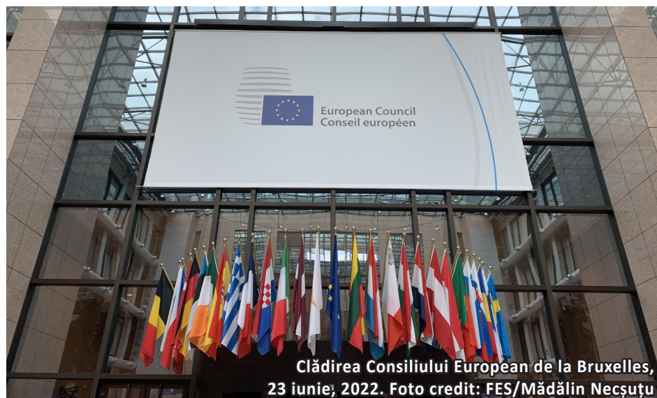
Clădirea Consiliului European de la Bruxelles, 23 iunie, 2022.

Republica Moldova a mai făcut un pas pe calea europeană pe care și-a propus, după primirea pe 23 iunie a statutului de țară candidată la UE. Ceea ce trebuie remarcat este faptul că Republica Moldova trece din zona politicilor de vecinătate ale UE în cea de țară candidată pentru accesarea în UE, ceea ce