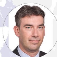
Dragoș Tudorache, Membru al Parlamentului European, Raportor al Parlamentului European pentru Republica Moldova (Grupul Renew Europe)