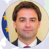
Nicu Popescu, Director al Programului Europa Extinsă în cadrul Consiliului European pentru Afaceri Externe (ECFR, Paris), ex-ministru al Afacerilor Externe și Integrării Europene