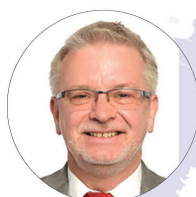
Michael Gahler, Membru al Parlamentului European, Vice-președinte Grupului PPE, Membru AFET