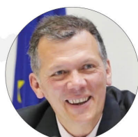
Mathieu Bousquet, Șef de Unitate, Georgia și Moldova, DG NEAR, Comisia Europeană