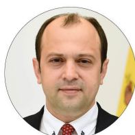
E.S. Oleg Țulea, Ministru al Afacerilor Externe și Integrării Europene