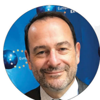
Luc Devigne, Director General adjunct pentru relații cu Rusia, Parteneriatul Estic, Asia Centrală și OSCE în cadrul Serviciului European de Acțiune Externă (SEAE)