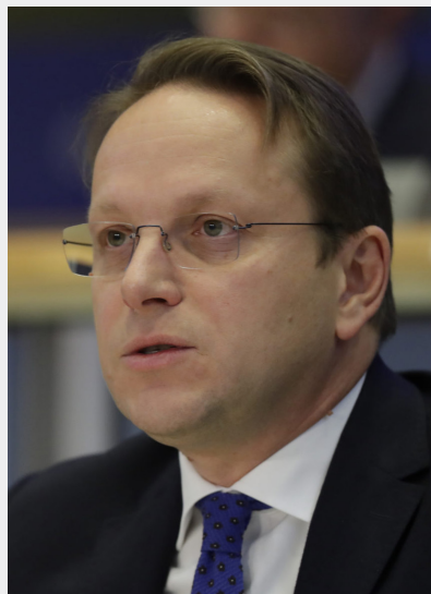
Olivér Várhelyi, Comisarul UE pentru Politica Europeană de Vecinătate și Negocierile de Extindere

În această perioadă cu provocări majore, marcată de izbucnirea epidemiei de coronavirus, observăm cât de importantă este cooperarea internațională. În ultima decadă, Parteneriatul Estic a adus beneficii tangibile cetățenilor din Republica Moldova, dar și celor din vecinătatea estică a Uniunii Europene.