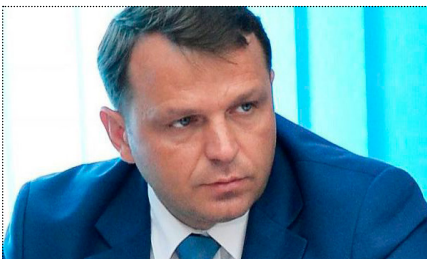
Andrei Năstase, președinte al Platformei „Demnitare și Adevăr”