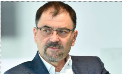
Anatol Șalaru, președinte executiv al Partidului Unității Naționale