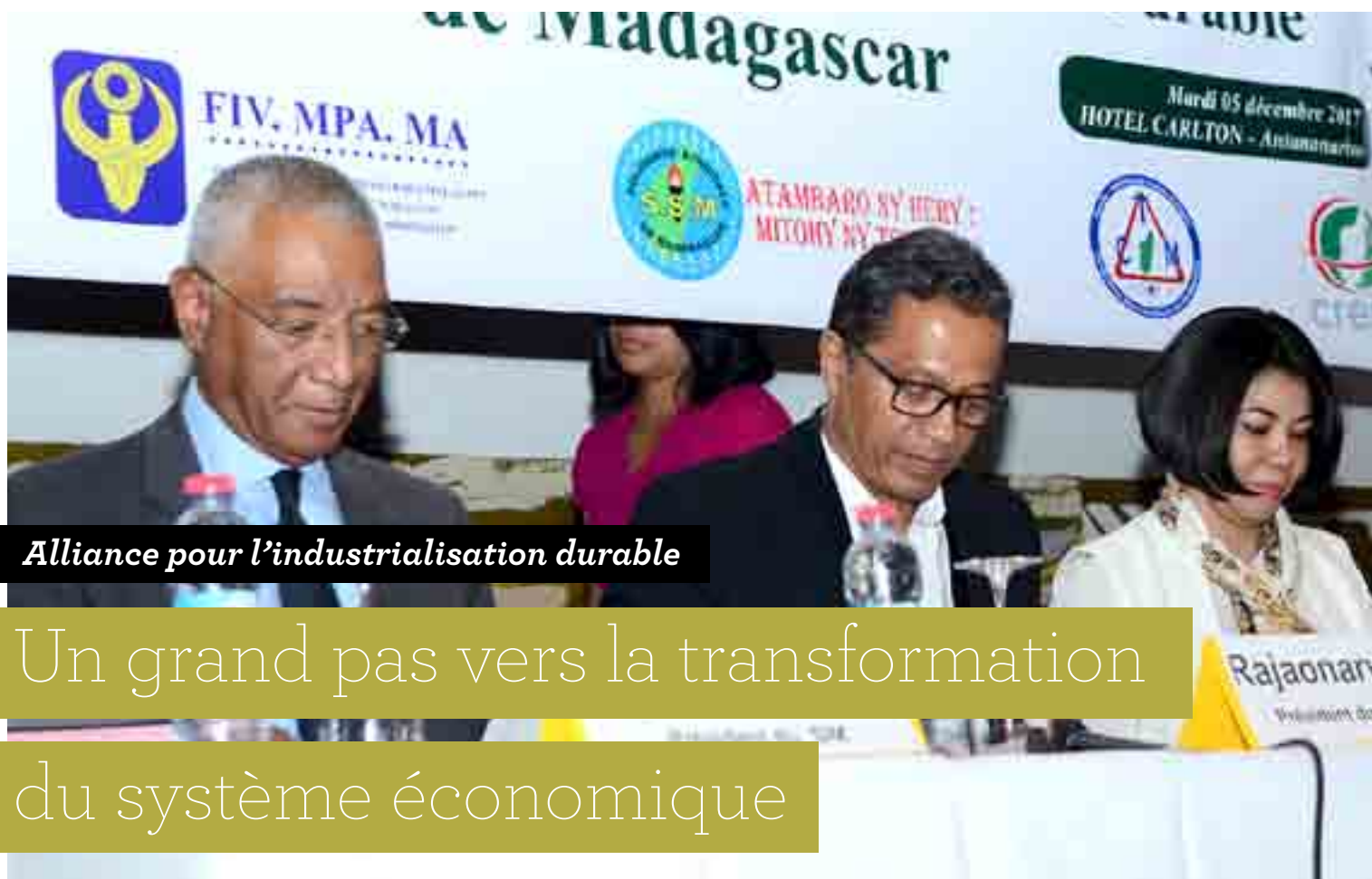
Alliance pour l'industrialisation durable