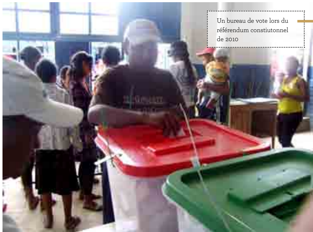
Un bureau de vote lors du référendum constitutionnel de 2010