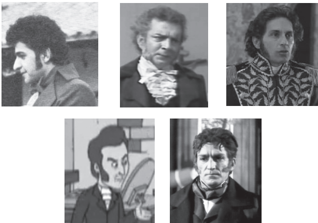
Ilustración 1. Nariños.

Me permito tomar una posición. A diferencia de héroes como Bolívar, que tendría una trascendencia amplia más allá de las fronteras, Nariño constituye por excelencia el héroe Nacional en mayúscula. Su figura representa precisamente ese referente propio único y tal vez podríamos decir local. La figura de Nariño asociada con la libertad de las ideas, con los derechos del hombre traídos a la propia patria es una especie de conexión de un local para unirnos al rumbo del mundo .