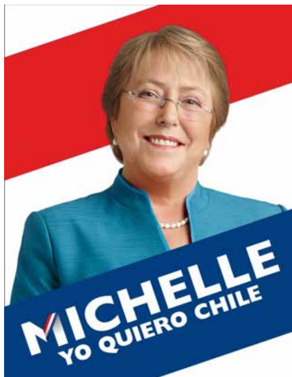
Figura 3: Pieza de la campaña de Michelle Bachelet.

El estudio también señala que el logro mejora sólo levemente en la campaña presidencial en relación a las primarias. En un caso específico,