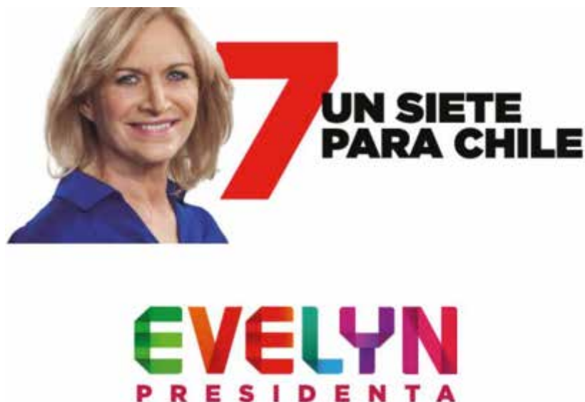
Figura 5: Pieza de la campaña de Evelyn Matthei

Estas acciones entre lo público y lo privado, entre el Estado y el mercado son la base de la corrupción que actualmente enfrenta Chile, porque la combinación entre “mercado e intervención estatal” es clave en el caso chileno (Chomsky, 2009: 81 y 82), puesto que, como hemos visto es transversal e implica de igual manera a políticos de los dos grandes conglomerados y de los partidos políticos. La cobertura mediática hoy se centra