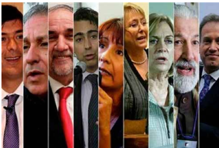
Figura 1: Los 9 candidatos de la primera vuelta electoral

Posteriormente, a los dos candidatos de ambos conglomerados se suman otros siete, quienes participaron en la primera vuelta electoral. La candidata de la Centro-Derecha Evelyn Matthei reemplazó a Pablo Longueira, el candidato que surgió de las primarias de este sector, quien tuvo que retirarse por problemas de salud.