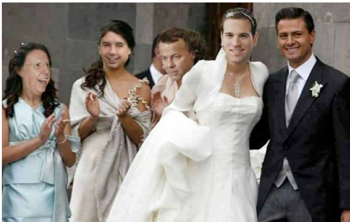
Figura 6. La boda de Enrique Peña Nieto con el conductor Carlos Loret de Mola. Joaquín López Dóriga, Emilio Azcárraga y Ciro Gómez Leyva aparecen como damas de honor 1 .

17 Tuckman, J. (11 de junio de 2013). WikiLeaks reveals US concerns over Televisa-Peña Nieto links in 2009. http://www.theguardian.com/world/2012/jun/11/wikileaks-us-concerns-televisa-pena-nieto