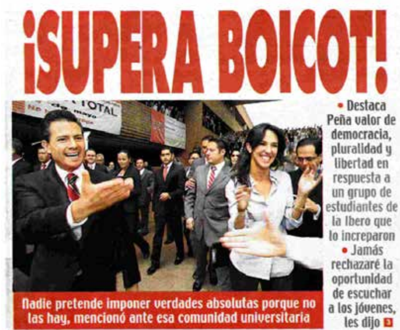
Figura 7. Portada de La Prensa , el 12 de mayo de 2012