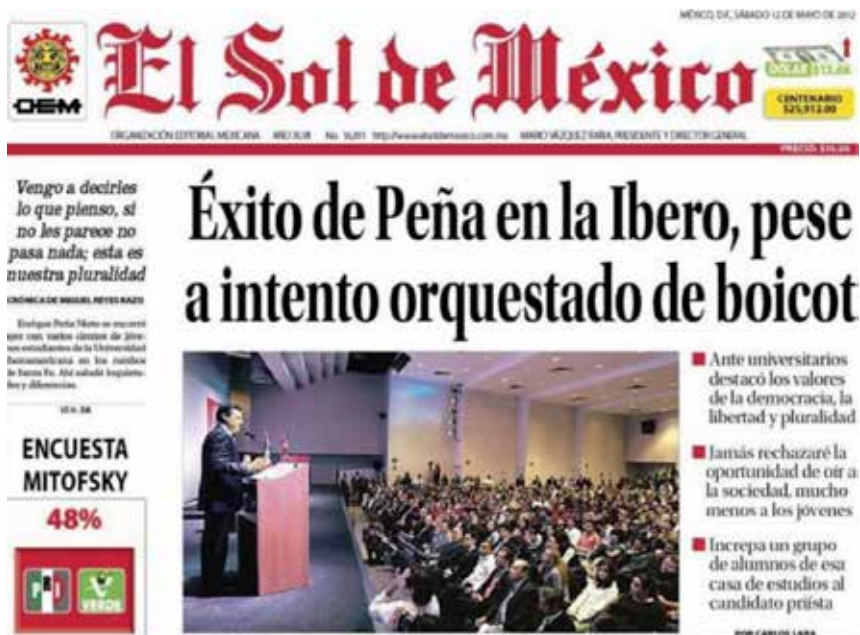
Figura 8. Portada de El Sol de México , 12 de mayo de 2012

a través de balas de goma y detenciones arbitrarias.