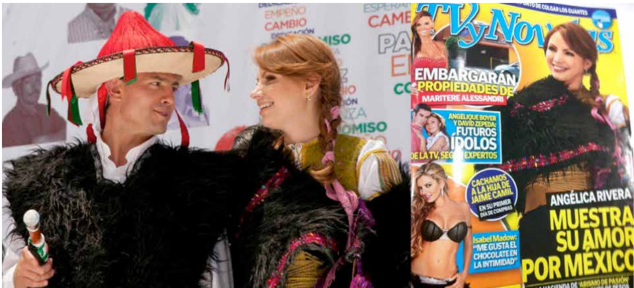
Figura 9. Portada de la revista TV y Novelas (Televisa) durante la campaña electoral