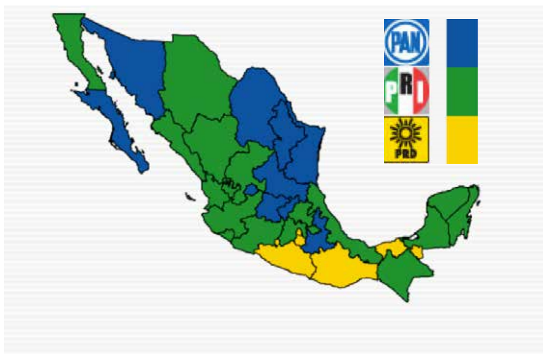
Figura 4. Resultados de la votación para Diputados por el Principio de Mayoría Relativa, por Partido Político (IFE, 2013)