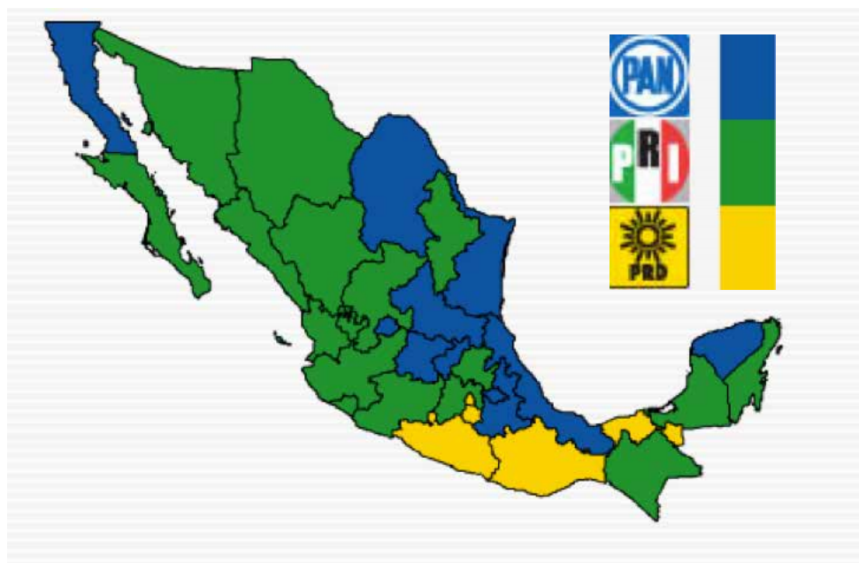
Figura 3. Resultados de la votación para Senadores por el Principio de Mayoría Relativa, por Partido Político (IFE, 2013)