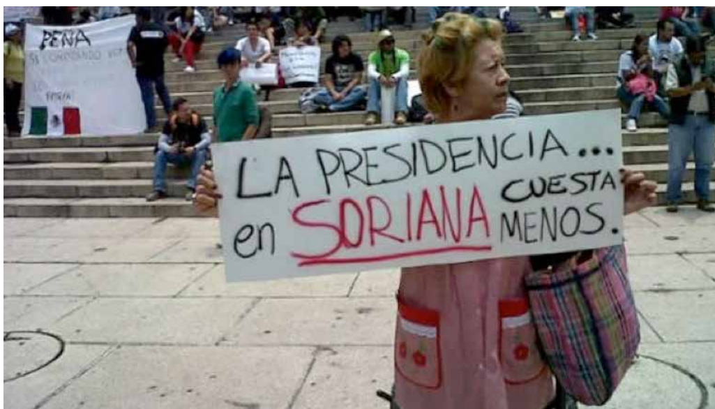
Figura 5. Manifestante denunciando el Sorianagate