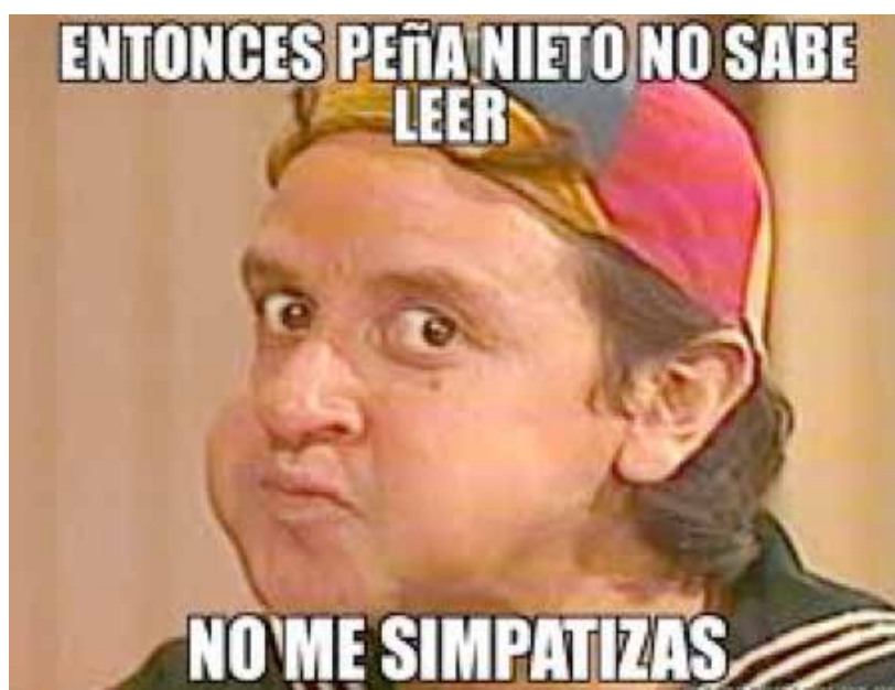
Figura 11. Memes de Peña Nieto circulando en la red