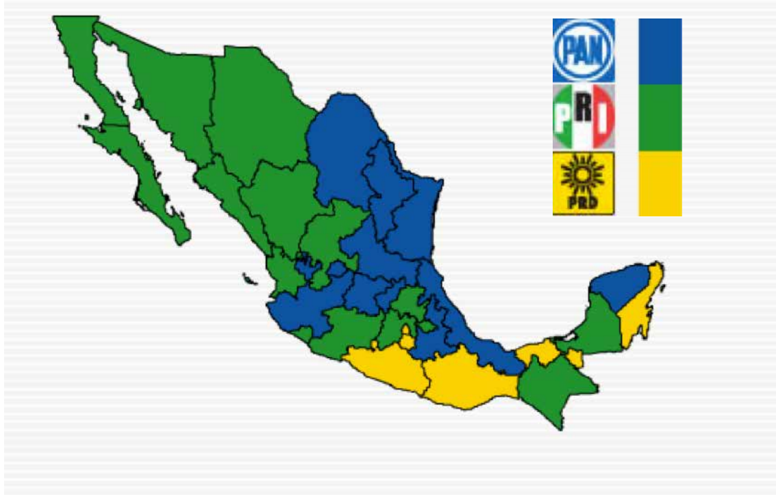
Figura 2. Resultados de la votación para Presidente de la República, por partido político y entidad federativa (IFE, 2013)