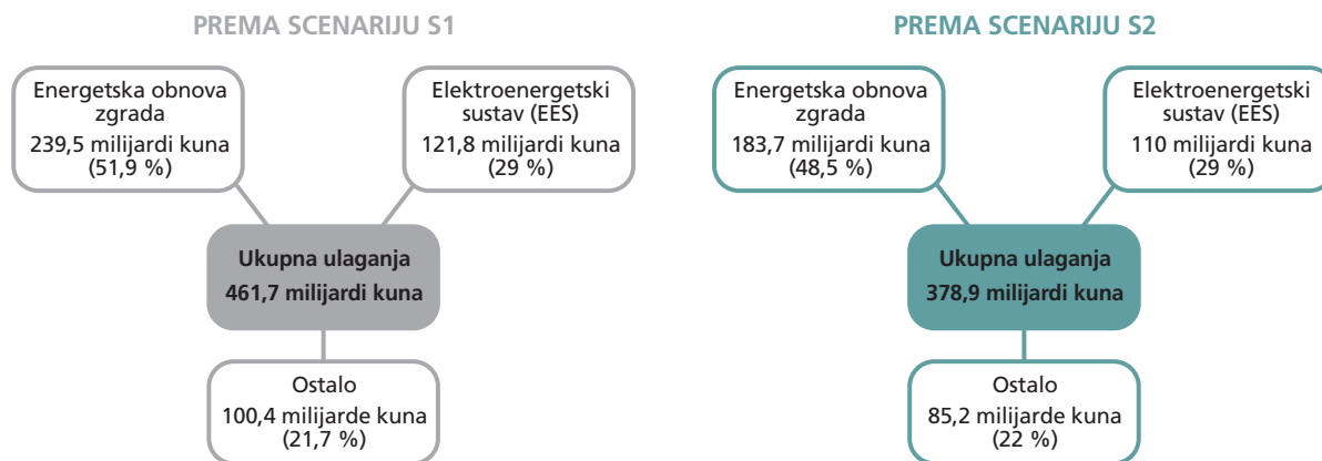
Slika 2 Ulaganja za ostvarenje energetske tranzicije

Na području Hrvatske neujednačena je distribucija raspoloživih kapaciteta za recikliranje. Glavnina je kapaciteta koncen- trirana u središnjoj i sjeverozapadnoj Hrvatskoj. Nedostatna je pokrivenost južnog dijela Hrvatske (Dalmacija i primorsko- gorska Hrvatska). U nekoliko županija ne postoji kapacitet za recikliranje otpadnog papira, plastike, stakla, metala i tek- stila: u Ličko-senjskoj županiji, Primorsko-goranskoj, Split- sko-dalmatinskoj, Šibensko-kninskoj i Zadarskoj županiji.