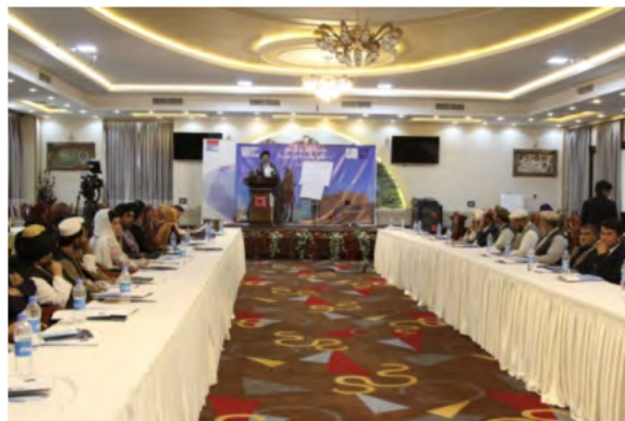
FES, MADPO, APPRO

پیش بینی گسترده ای که ارائه شد این بود که در صورت وقوع صلح، جنگ خاتمه خواهد یافت. بسیاری از آنان پیش بینی کردند که در صورت بهبود ثبات و اوضاع امنیتی، اعتماد سرمایه گذاران بالقوه جلب خواهد شد، داد و ستد و تجارت افزایش خواهد یافت و اشتغال زایی در سکتور عامه بخصوص در بخش های معارف و صحت عامه ادامه خواهد یافت که این موارد در ترکیب با یکدیگر منجر به بهبود اوضاع اقتصادی خواهند شد. با کاهش جنگ بیجاشده گی داخلی نیز کمتر خواهد شد و از این رو از فشار بر زیربنای شهری و مراکز خدماتی که باید به تعداد فزاینده ای از بیجاشده گان آواره به مراکز شهرها خدمات ارائه کنند، کاسته خواهد شد.