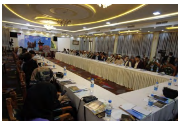
FES, MADPO, APPRO

میزان بالای بیکاری منجر به فقر گسترده در ساحات شهری و روستایی شده است. ناتوانی اکثر خانواده ها در امرار معاش به طور برجسته ای به عنوان دلیل پیوستن جوانان به گروه های مسلح مخالف دولت مورد اشاره قرار گرفته است.