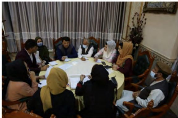
FES, MADPO, APPRO

قانون گریزی سیستماتیک به عنوان عامل عمدهٔ منازعه در اجتماعات مختلف مورد اشاره قرار گرفت، بخصوص قانون شکنی مقامات که مسئول تنفیذ قانون هستند.