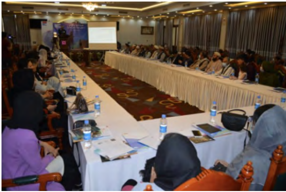
FES, MADPO, APPRO

به مانند دیگر گردهمایی های محلی که قبلاً برگزار شد، اشتراک کنندگان به چند گروه تقسیم شدند و از هر گروه خواسته شد تا محرک ها و عوامل اصلی جنگ را در محله یا اجتماع شان شناسایی کنند. از گروه ها همچنان خواسته شد تا راه های مناسب را برای پرداختن به عوامل جنگ و ایجاد شرایط صلح پایدار پیشنهاد دهند.