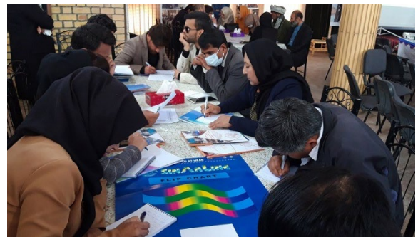
FES، MADPO، APPRO انځور/

په پای کې، مدني ټولنه د یوه داسې مهم بنکېل لوري په توګه په پام کې ونیول شوه چې د پروژو پر پلي کېدلو د څارنې له لارې باید د پارلمان او ولایتي شورا له وکیلانو څخه حساب وغواړي او له قانون څخه د سرغړونو د موندلو پرمهال، د هغوی پر وړاندې دعوا ثبت کړي. یوه ګډونوال یادونه وکړه چې د عامه دعوا ثبتول په خپلو مسئولیتونو د دولت پوهولو او د قانوني مکلفیتونو ترسره کولو ته د اړ ایستلو یوه لاره ده.