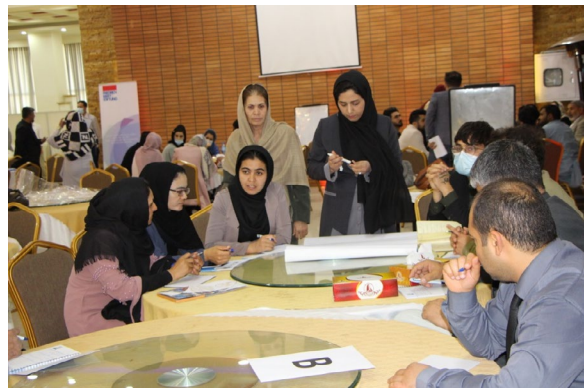
FES، MADPO، APPRO / استودیوی عکاسی و فیلمبرداری

در پایان، اشتراک کنندگان نقش رسانه ها و سازمان های جامعه مدنی را در مقابله با دیدگاه های تفرقه انگیز و اشاعه مشترکات به جای تمایزات و اختلافات مورد تأکید قرار دادند.