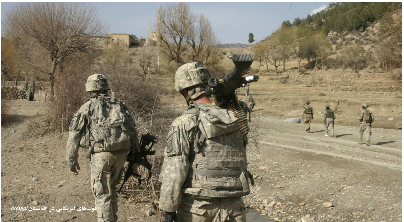
فوت های امریکایی در افغانستان