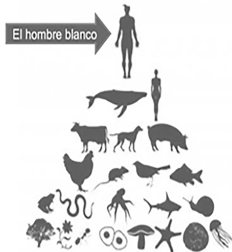
Figura 1 Pirámide de jerarquías

A partir de la colonización se impusieron modelos de vida diferentes, donde la vida de los humanos no privilegiados y del resto de seres vivos adquiere un valor diferente. Ese cambio de pensamiento alejó a la humanidad de su papel simbiótico con la naturaleza y ha sido la causante de la serie de problemáticas ambientales en las que la actualidad está sumergida. El modelo económico impuesto desde entonces, se ha encargado de extraer todo lo posible de los territorios: bienes naturales, fuerza humana, dignidad, libertad y vida. Un modelo que desprecia la vida para enriquecer al 1% de la población humana, quienes a través del despojo se adjudicaron los medios de producción de un territorio diverso.