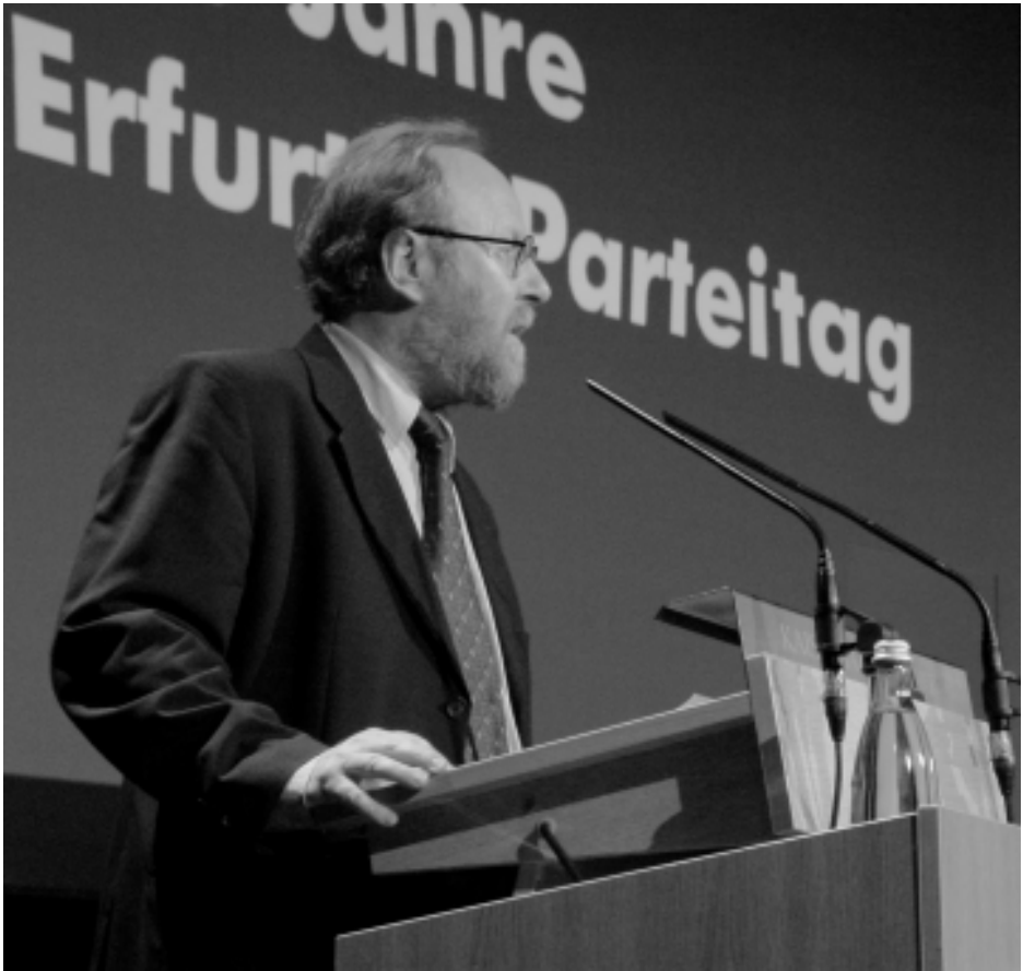
Wolfgang Thierse