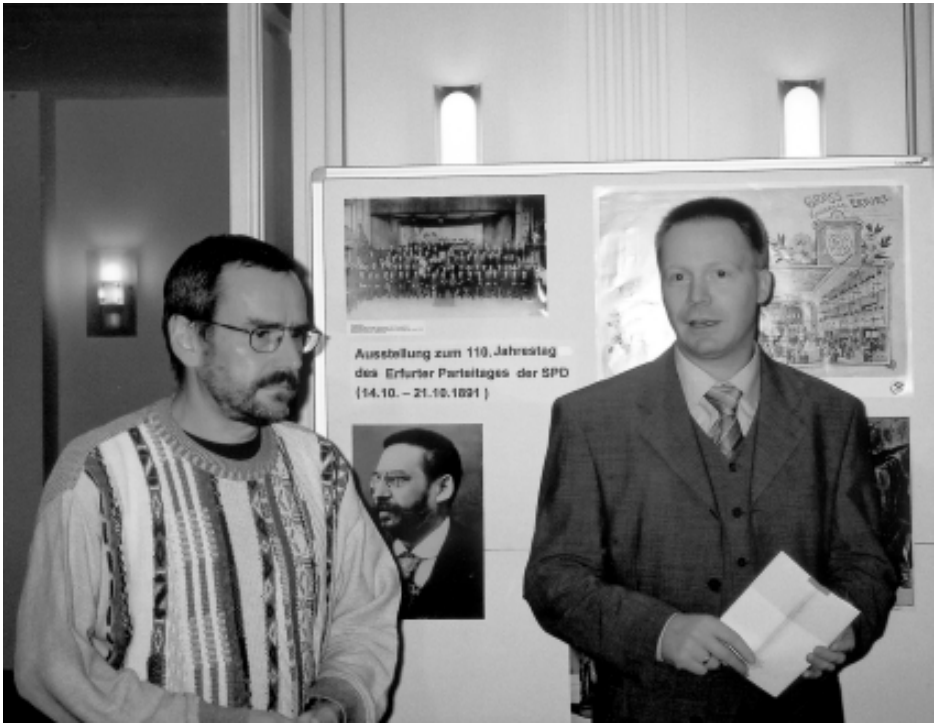
Christoph Matschie, Landesvorsitzender der SPD Thüringen und Urs Warweg, Vorsitzender des SPD Kreisverbandes Erfurt bei der Eröffnung der Ausstellung