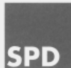
Titelblatt der Broschüre „100 Jahre SPD Eisenberg“

SOZIALDEMOKRATISCHE PARTEI DEUTSCHLANDS IN EISENBERG