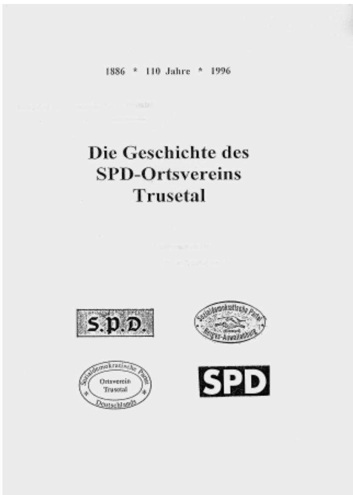
Titelblatt: SPD-Ortsgeschichte Trusetal

Und damit bin ich wieder in Thüringen. Eine kraftvolle Partei sind wir dauerhaft nur dann, wenn wir auf der Höhe der Zeit sind. Wenn wir glaubhafte Antworten geben auf die Fragen, die die Menschen hier bewegen. Und wenn klar ist: Die SPD ist kein Blatt im Wind. Auf die SPD ist Verlass, auch in schwieriger Zeit.