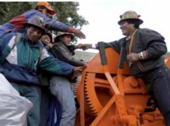
Presidente Morales en espera del rescate de los mineros de la mina San José.

dente Piñera que “la demanda marítima es un tema fundamental, central, privilegiado e ineludible ( La Prensa , Los Tiempos , La Razón , El Nuevo Diario , El Deber y Correo del Sur ).