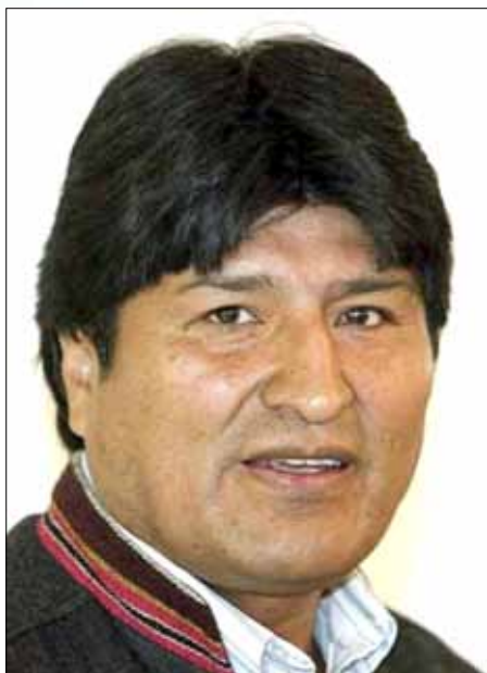
En su viaje a las ceremonias del Bicentenario, el presidente Evo Morales resaltó "la confianza lograda con Chile".

Los primeros meses en las relaciones bilaterales han sido sorprendentemente positivos, algo que ha sido reafirmado por autoridades de ambos países al ver no sólo una continuidad con lo avanzado en la anterior administración de la presidenta Bachelet, sino una profundización de lo ya realizado hasta el año 2009.