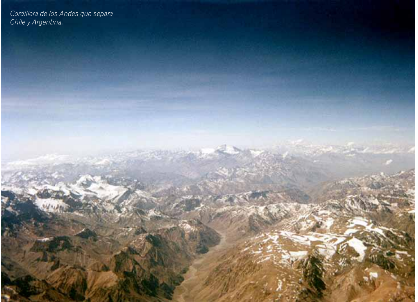
Cordillera de los Andes que separa Chile y Argentina.