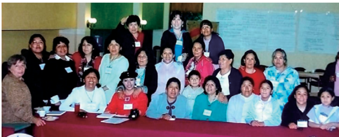
Las mujeres que participamos en la Red en 2007.

Ahora, con 15 años de vida, el boletín Germina mantiene su vigencia; nuevas compañeras comparten sus experiencias sobre el avance del sindicalismo en Bolivia y participan mujeres que ejercen como ejecutivas de diferentes sindicatos, sin miedo a asumir retos. Vemos también que hay algunos cambios en el logo, lo que significa que hay nuevas ideas. Asimismo, ha cambiado el diseño de las páginas, que se ven mejor, mientras que las temáticas son muy objetivas. Sigamos adelante enriqueciendo nuestro canal de comunicación, transmitiendo nuestras ideas y convicciones sindicales hacia un mejor futuro para las mujeres sindicalistas.