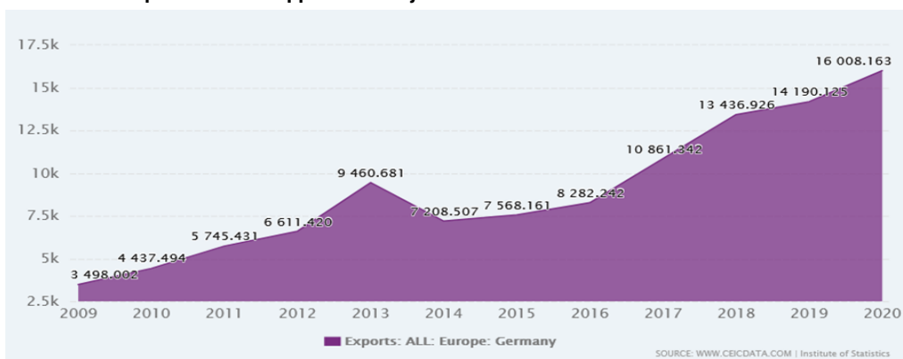
Figura 1: Niveli i eksporteve të Shqipërisë në Gjermani: 2009-2020 6