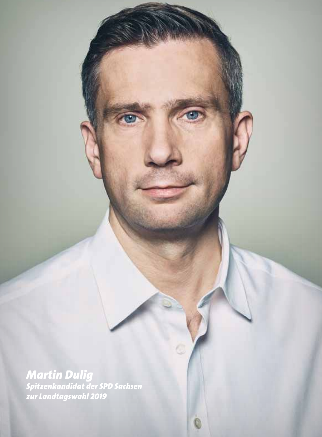
Martin Dulig Spitzenkandidat der SPD Sachsen zur Landtagswahl 2019