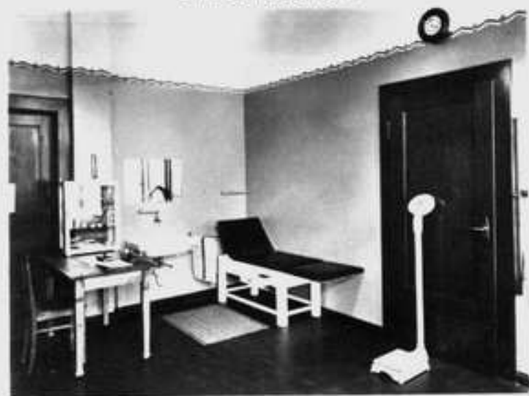
Ein Zimmer der Sportärztlichen Dienststelle