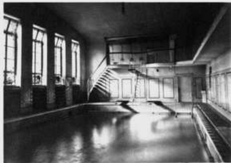
Die Schwimmhalle 8x14 Mtr. Wasserfläche.