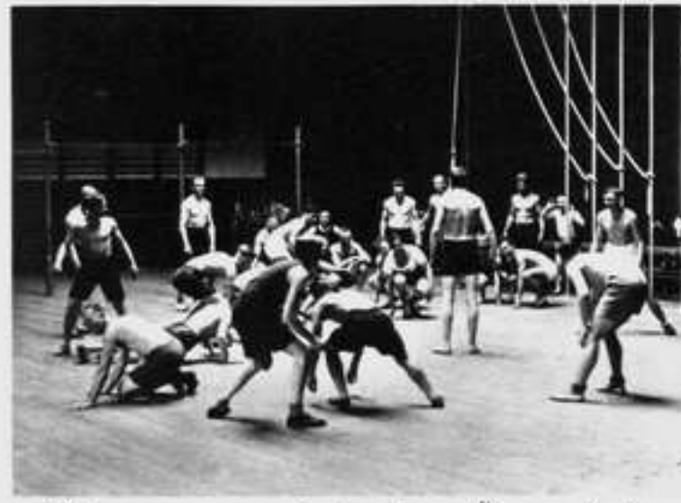
Übungsmoment in einer Übungshalle