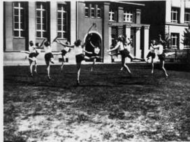
Übungsmoment auf dem Übungsplatz