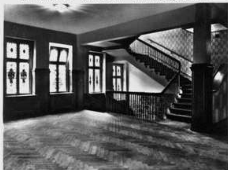
Der Vorräum vor den Lehrsälen im 1. Geschoß.