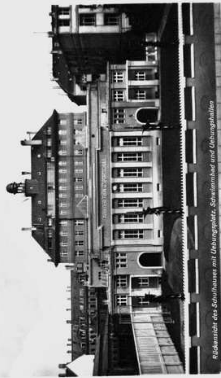
Rückansicht des Schulhauses mit Übungsplatz, Schwimmbad und Uebungshallen