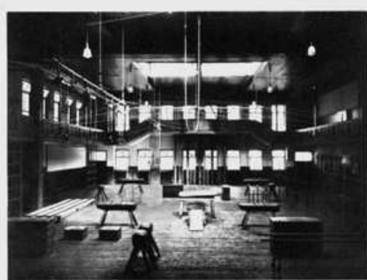
Östliches Teil der Halle