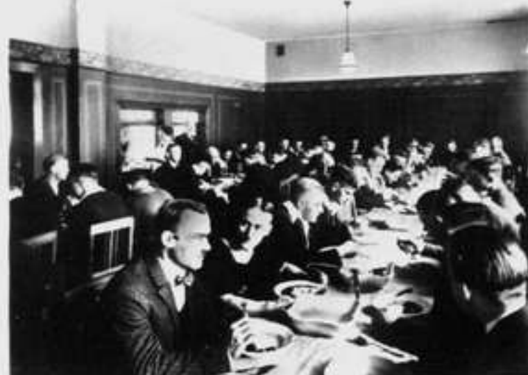
Der Speisesaal in Betrieb