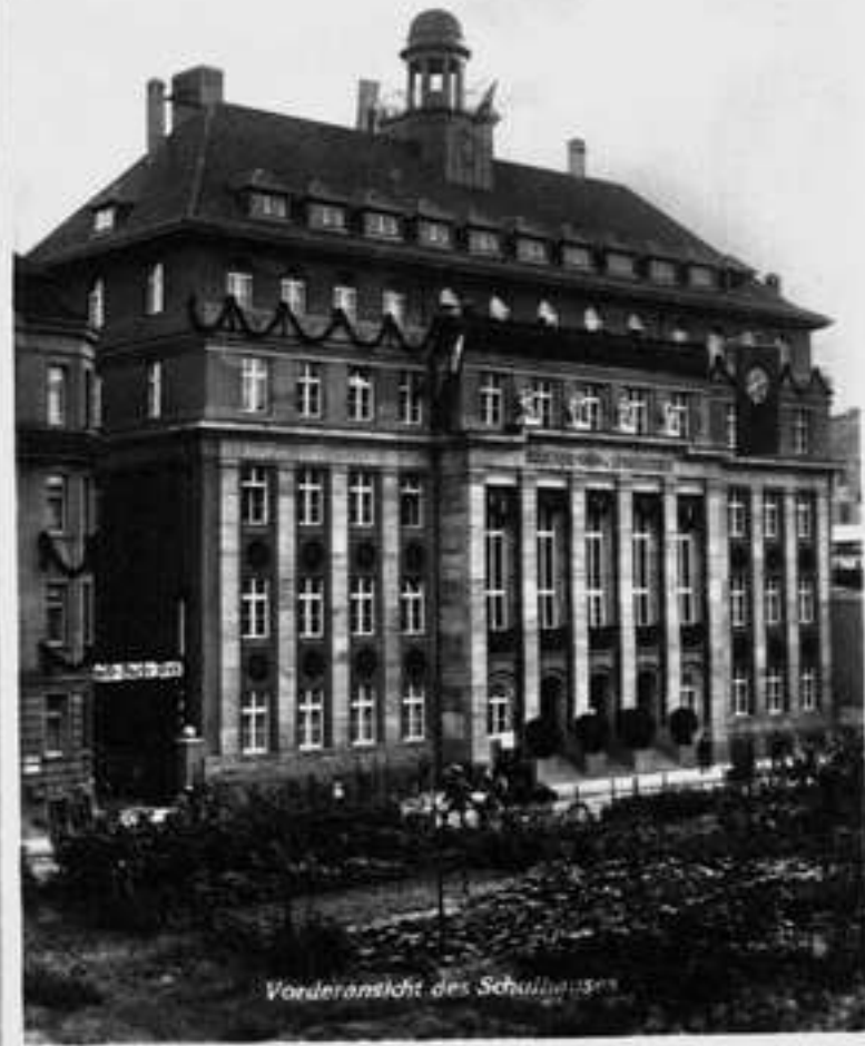
Vorderansicht des Schulhauses