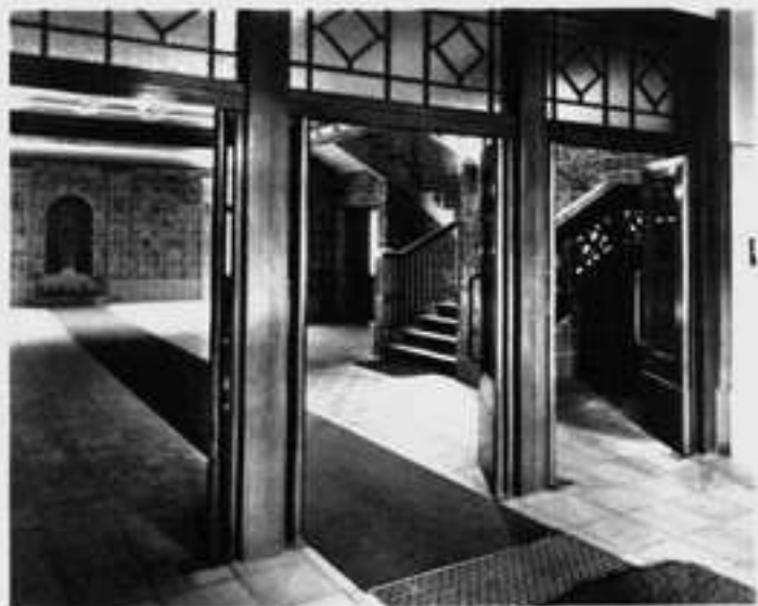
Der Keramik Vorräum im Erdgeschoß.