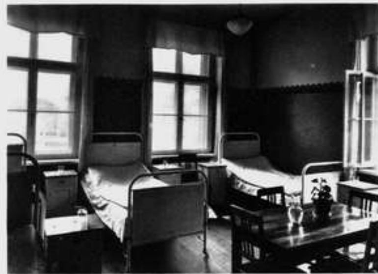
Eins der 18 Schlafzimmer