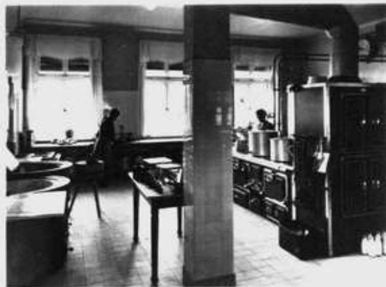
Ein Blick in die Küche