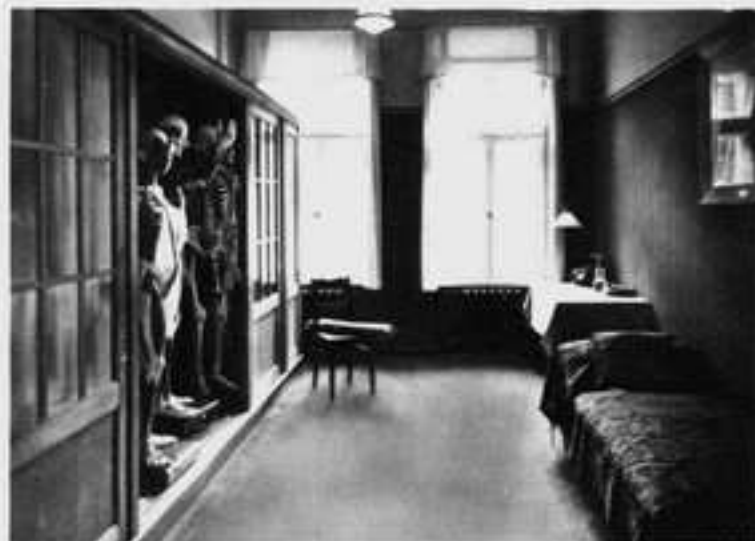
Das Modellzimmer der Schule