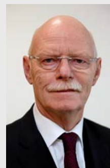
Dr. Peter Struck Vorsitzender der Friedrich-Ebert-Stiftung

Wir möchten Sie herzlich einladen und ermutigen, sich engagiert und leidenschaftlich an diesem Diskurs zu beteiligen. Unsere Politische Akademie wird mit einem Demokratiekongress in Berlin am 29./30. Juni 2011 hierzu ein Forum bieten.