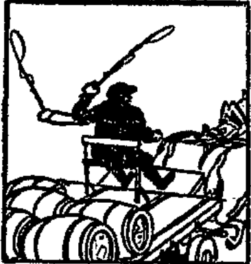
Peilste seitwärts strecken und nach vorn bewegen heißt: Ueberholen.