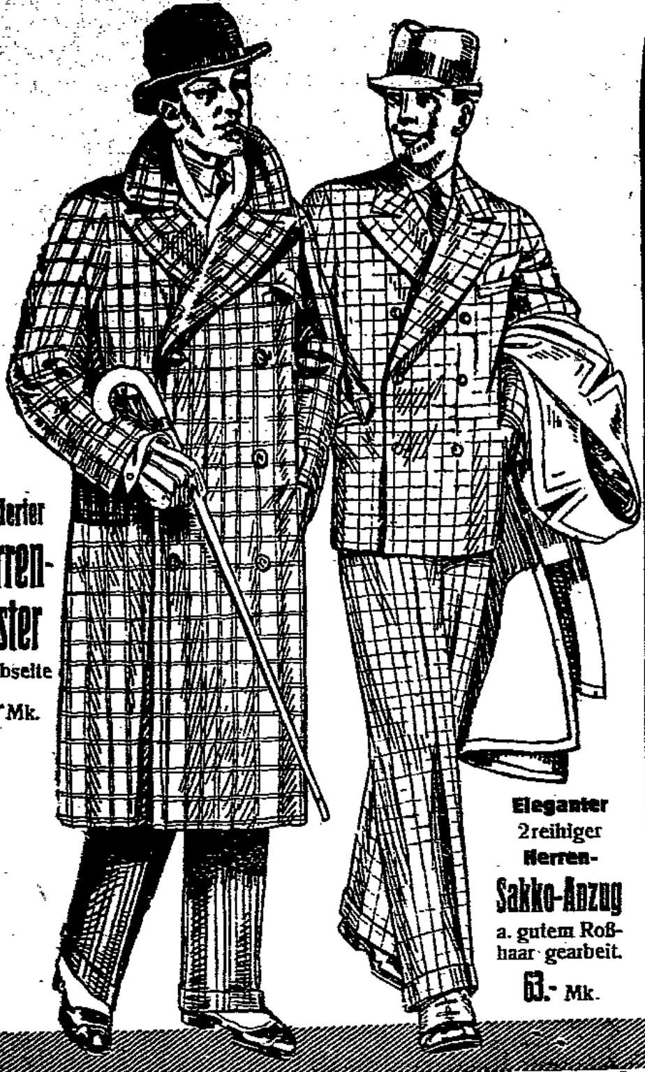
Karierter Herren- Ulster in Abselte 49,- Mk.