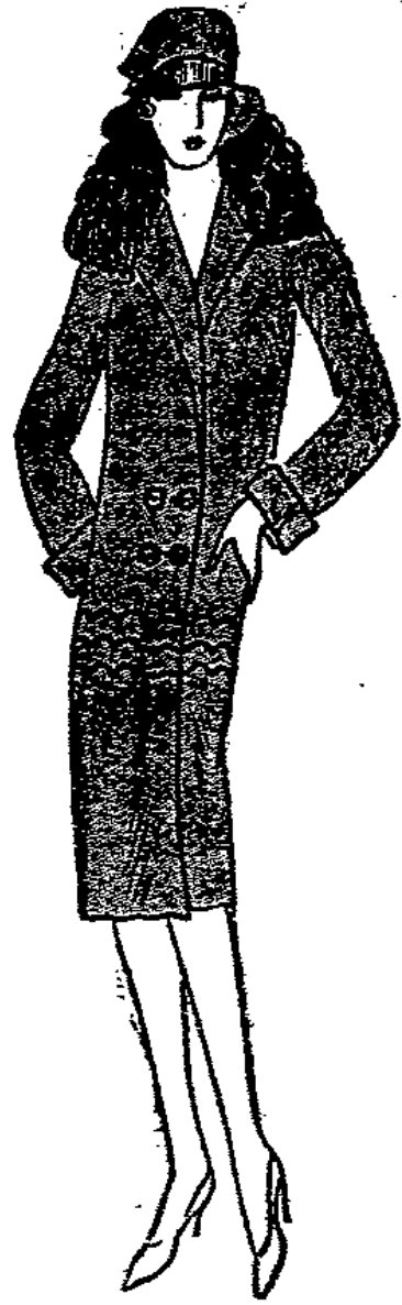
Jugendlicher Mantel aus Velour de laine, mit Pelzkragen . . . . . 29 50