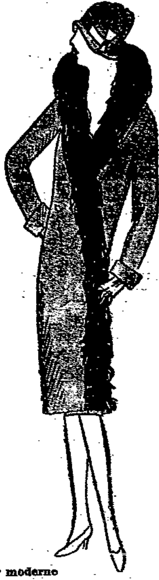
Der moderne Wickelmantel aus reinwollener Ottomane, mit Moquette-Besatz 59 00