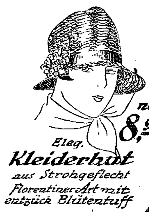
Eleg. Kleiderhut aus Strohgeflecht Florentiner Art mit entzück Blütentuff nur 8,90