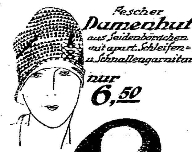
Fescher Damenhut aus Seidenbördchen mit apart. Schleifen- u. Schnallengarnitur nur 6,50