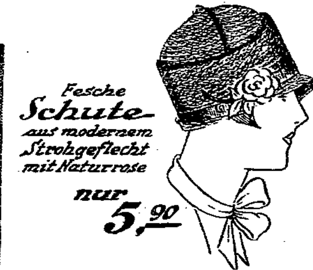
Fesche Schute aus modernem Strohgeflecht mit Naturrose nur 5,90