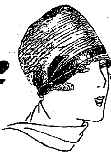
Jugendl. Glocke aus modernem bunt. Geflecht nur 4,75