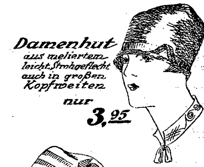
Damenhut aus meliertem leicht. Strohgeflecht auch in großen Kopfweiten nur 3,95