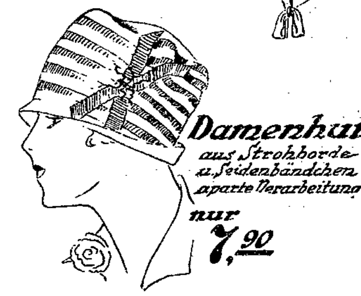
Damenhut aus Strohborde u. Seidenbändchen aparte Verarbeitung nur 7,90