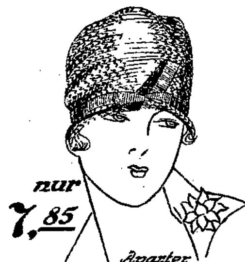
nur 7,85 Aparter