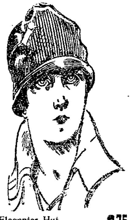
Eleganter Hut in aparter Abarbeitung 6,75

Haus der Hüte MAGDEBURG Breiter Weg 193 nahe Steinstraße