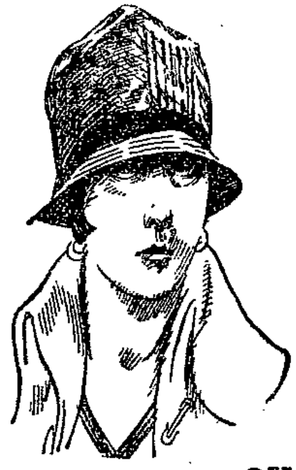
Fescher jugendlicher Hut, in Moiré . . . . . 2,75

Der ERFOLG unserer Werbe-Tage veranlaßt uns zur VERLÄNGERUNG Wir bieten größte Vorteile