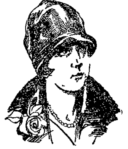
Entzückender Hut mit reicher Goldstickerei 4,75