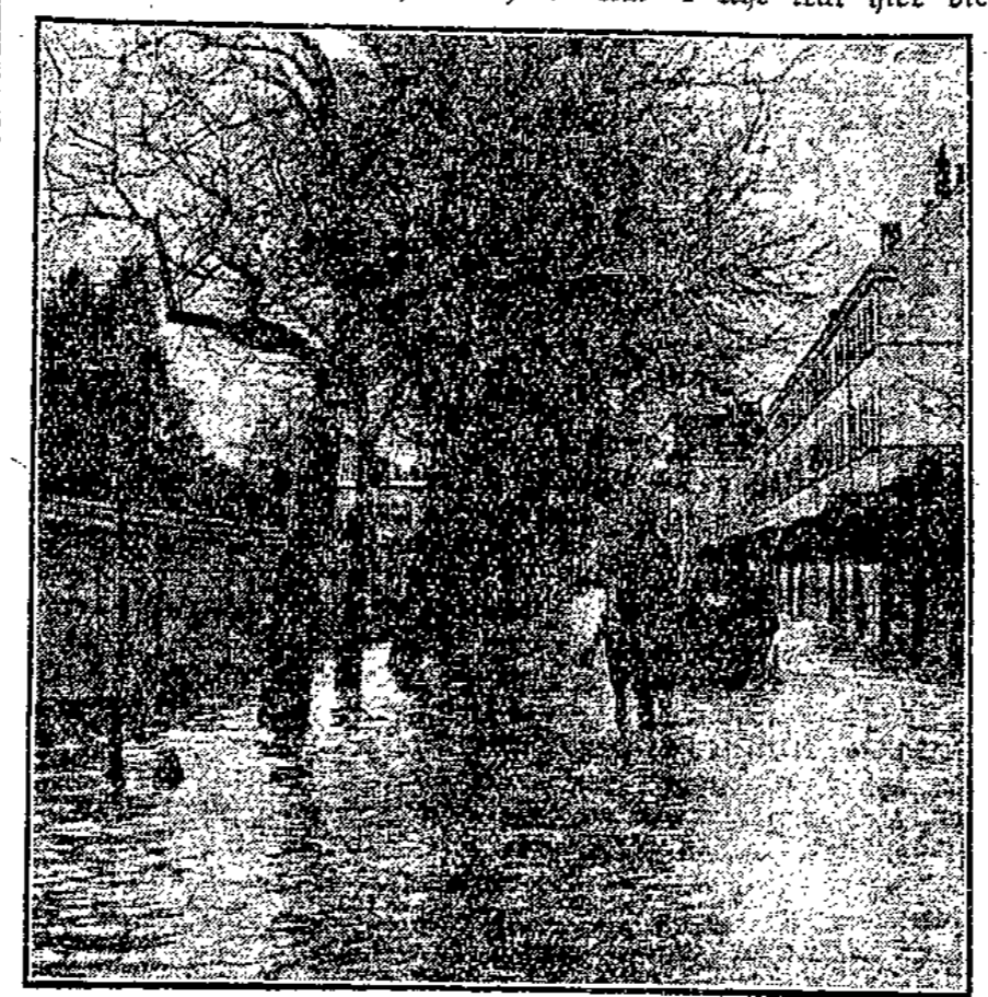
Straße in Quedlinburg.

Infolge der plötzlichen Schneeschmelze und der Regenfälle gab es schon Tage vor der Katastrophe Hochwasser in der Bode. Die erste Nachricht, daß der Brühl überschwemmt sei, lockte zunächst zahlreiche Bürger hinaus, um sich das Schauspiel anzusehen.