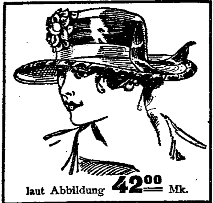
laut Abbildung 42 00 Mk.