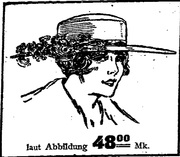
laut Abbildung 48 00 Mk.