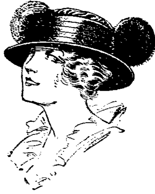
Trotteur aus handgenähter Strohhüte, mit Noirekopf und Pompons garniert . . . 7.85

Fescher Matelot 6.85 Eigengeflecht, schwarz und couleuré, mit Noire und Pompons garniert.