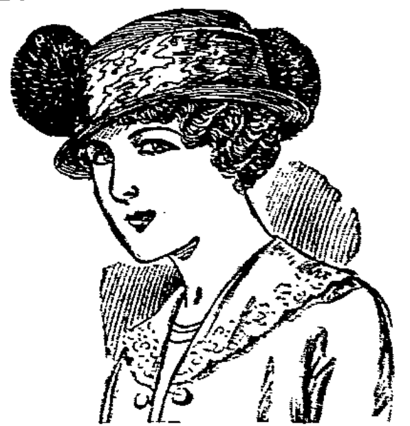
Schottenhut Feiner Matelot, ganz aus schottisch. Seide, mit Pompons garniert . . . 6.50