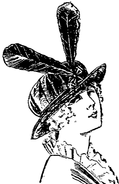
Neuer Matelot handgenäht, mit Noirekopf und Pulverten . . . . . 5.75