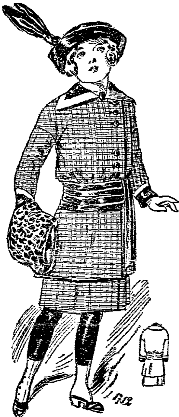
1712. Neues Kostüm mit Schößbluse für Mädchen von 11—13 Jahren.

1809. Schalkleid. Aus Bluse und Rock bestehend, ist das Kleid im Zusammenhang mit schottischen Schräglenden besetzt worden. Dazu passender Kragen und Hermelausschlage. Gebraucht werden etwa: 2 m Cheviot; 0,50 m kariertes, etwas weißer Stoff; Blusenfutter; Lederbügel.