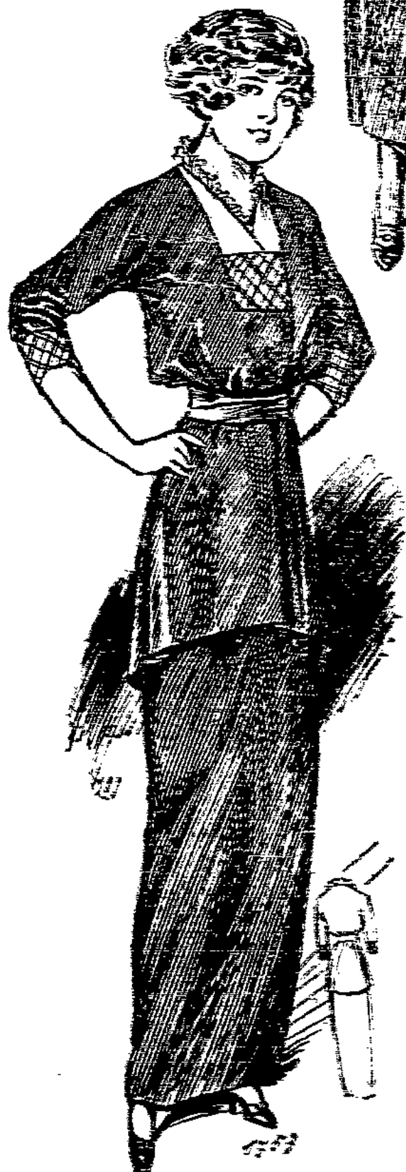
1749. Festkleid mit loser Bluse u. neuem Rock für das Alter von 14—16 Jahren.