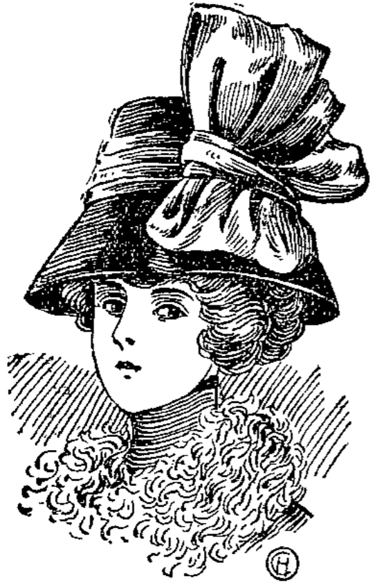
Moderne tiefe Glocke in schwarz und farbig, fesch mit glänzender Seide garniert 265 laut Abbildung