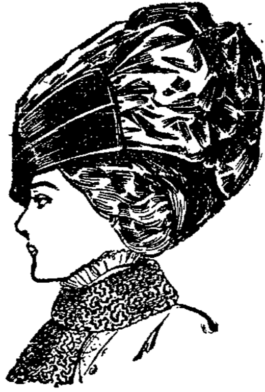
Toque moderner Frauenhut aus Rohstoff und Samt gesteckt 650 laut Abbildung