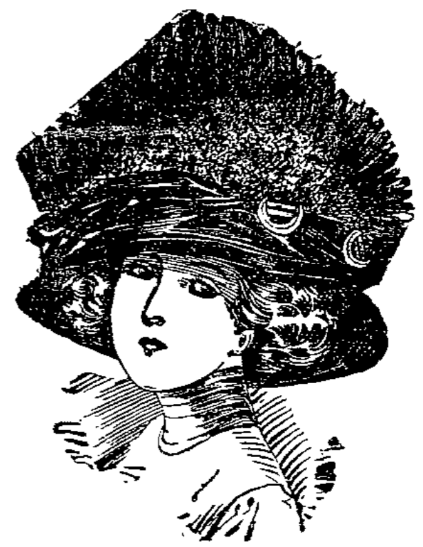
Flotte große Glocke mit elegantem Flügel und Samt garniert, in sehr vielen Farben laut Abbildung 1000