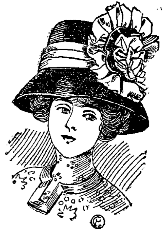
Topf-Glocke mit Seidenstoff und Samt garniert 500 laut Abbildung