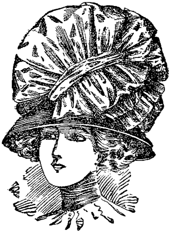
Jugendliche Glocke mit grosser Seidenstoff-Garnitur 850 laut Abbildung