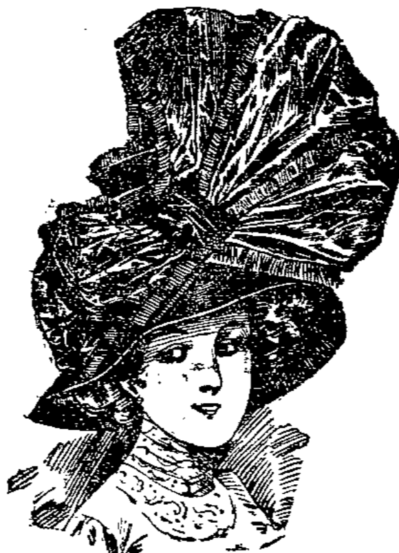
Niniche-Glocke mit 2 Farben Seidenstoff garniert, in vielen Farben laut Abbildung 875