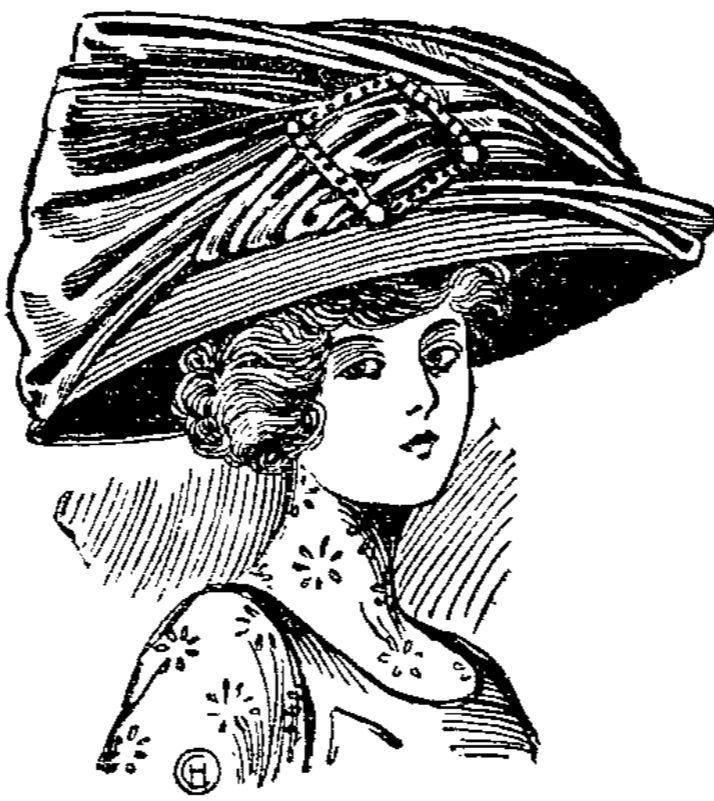
Großer Filzhut mit flotter Taffetschleife und Schnalle laut Abbildung 775