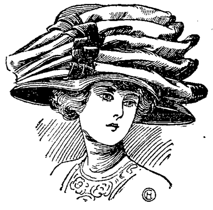
Niniche-Glocke mit Seidenstoff und Samtband reich garniert laut Abbildung 450