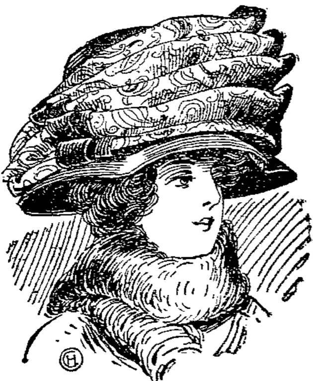
Niniche-Glocke mit türk. Seidenstoff und Samtband garniert laut Abbildung 500