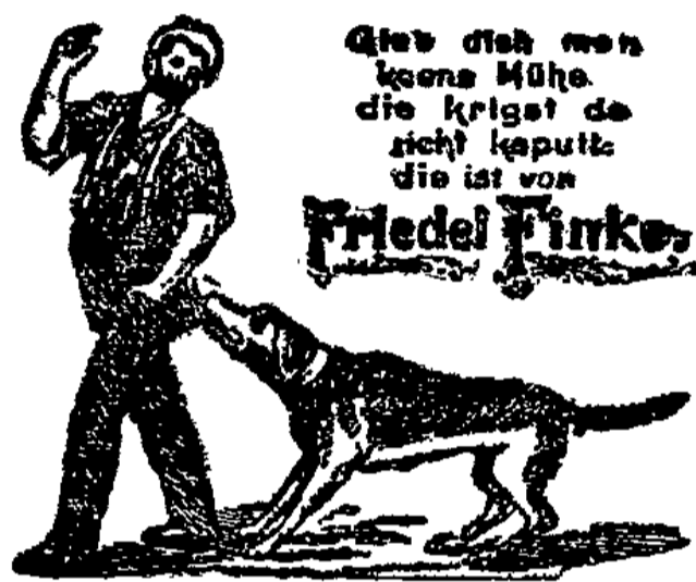
D. R. W. Z. 57 726.