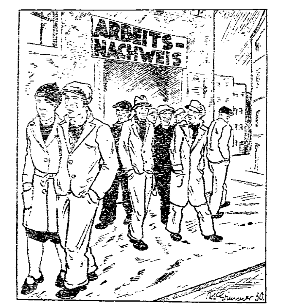
Eine halbe Million erwerbslose Jugendliche gibt es in Deutsch- land. Ein schweres unverschuldetes Geschick lastet auf diesen jungen Menschen. Die Sozialistische Arbeiterjugend fordert Beschaffung von Arbeit oder wenigstens ausreichende Arbeits- losen- und Krisenfürsorge für alle jungen Erwerbslosen. Du kannst diese Forderungen unterstützen, indem du Mitglied der SAJ wirst.

Hier liegt die große Aufgabe der sozialistischen Jugend- organisationen, deren günstige Entwicklung im Interesse der Par- tei und unseres Volkes aufs dringendste zu wünschen ist, und deren tatkräftige Förderung wir alle anstreben müssen.