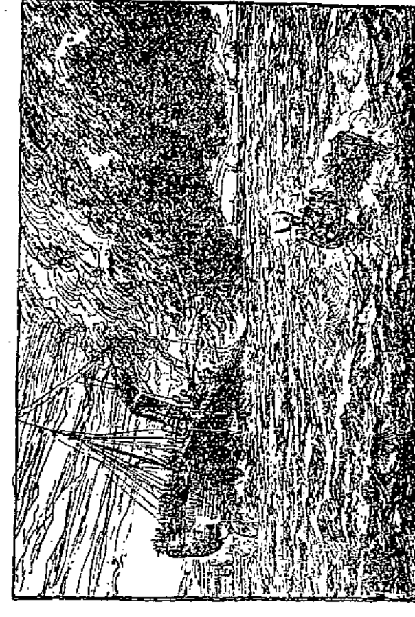
Die durch Funken bedruckten Dampfkerzen des "Volturno"

Die Trümmern des "Volturno" sind über die See verstreut.