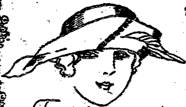
Frauenhut m. Bandgar- nitur u. Jettverzierung