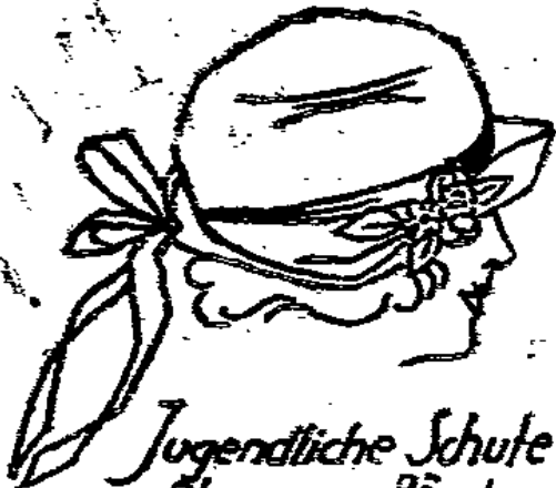
Jugendliche Schute m. Blumen u. Bändern