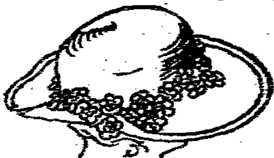
Große eleg. Blumenhut m. Seide abgefüllt