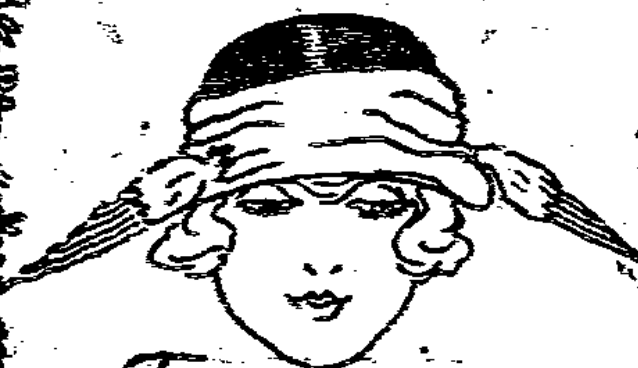
Toque m. Strohrand u. Flügel flott garniert