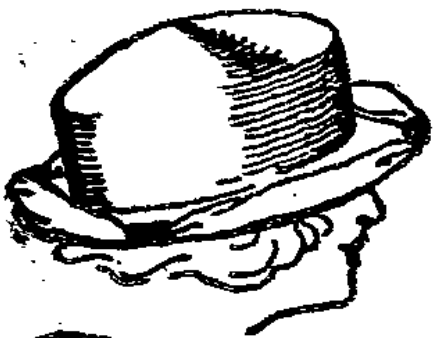
Tescher einfach garnierter Trolleur

Das Haus der guten Qualitäten und großen Sortimente