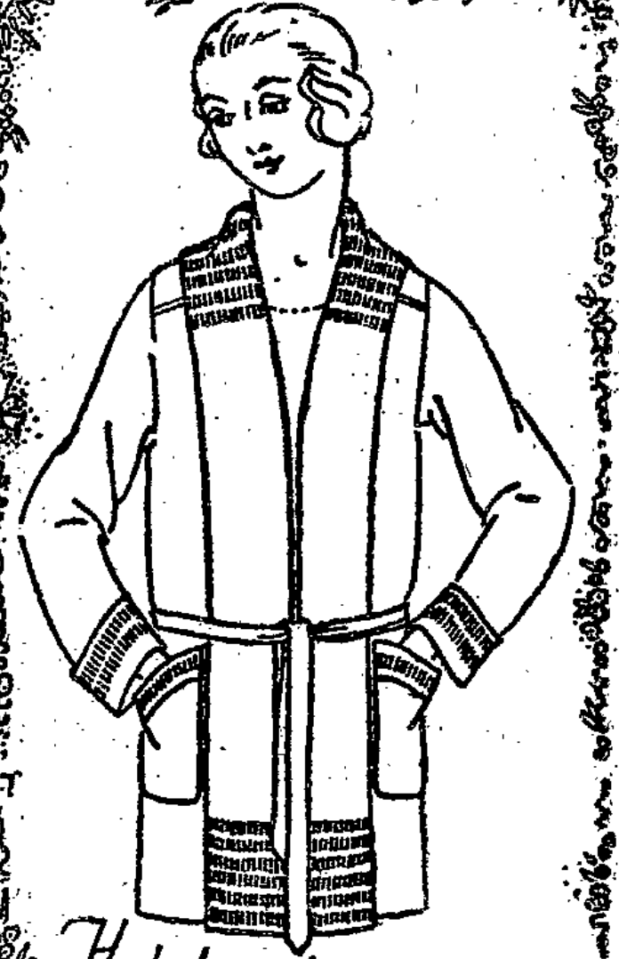
Hochelegante Damen-Sportjacke mit Schalkragen:

Wir unterscheiden uns bestens von vielen der glei- chen Tendenz durch die außergewöhnlich guten Qualitäten und die größten Sortimente, die dem Einfachen die Anschaffung ebenso möglich machen wird wie dem geschmacklich Verwöhnten. Besuchen Sie unsere 24 Schaufenster!