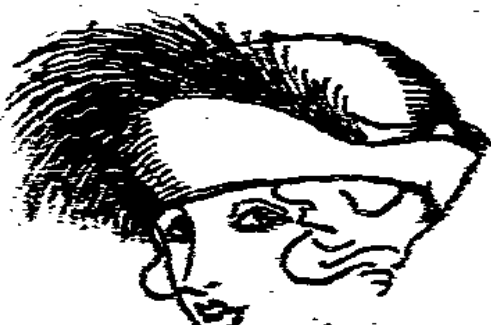
Gleg-form m. Seide ab- gefüllt u. echten Reihern