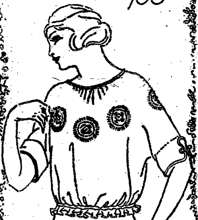
Bluse aus reinseidenem Paillette mit andersfarb. Applikation in verschiedenen Farbstellungen