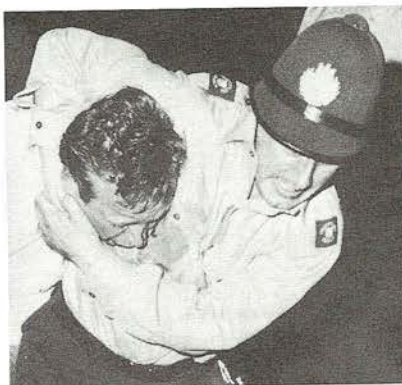
Gug: Züri Leu, 16.5.1969