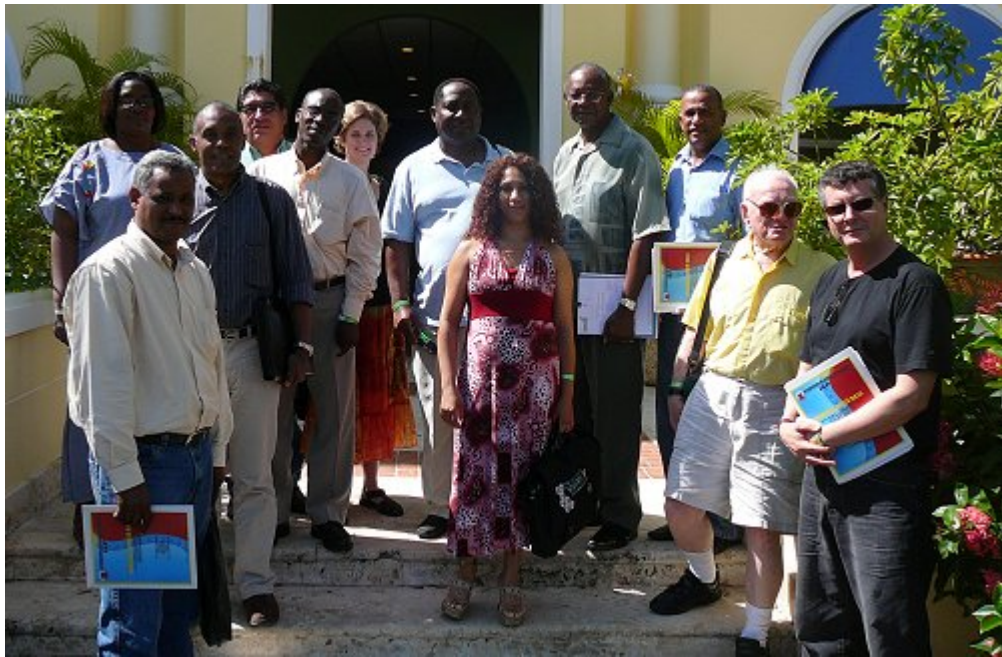
Nos días 13 y 14 de Noviembre en la Ciudad de Santo Domingo, Republica