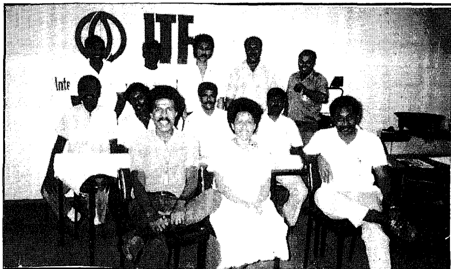
"Stärkung der Gewerkschaftsbewegung" war das Motto eines Seminars, das am 21. August 1990 auf dem Flughafen von Nadi (Fidschi) stattfand.

Angesichts der Tatsache, daß nur sehr wenig Frauen (alles in allem sieben) an diesen ersten Lehrgängen teilgenommen hatten, forderten sie Maßnahmen, um in