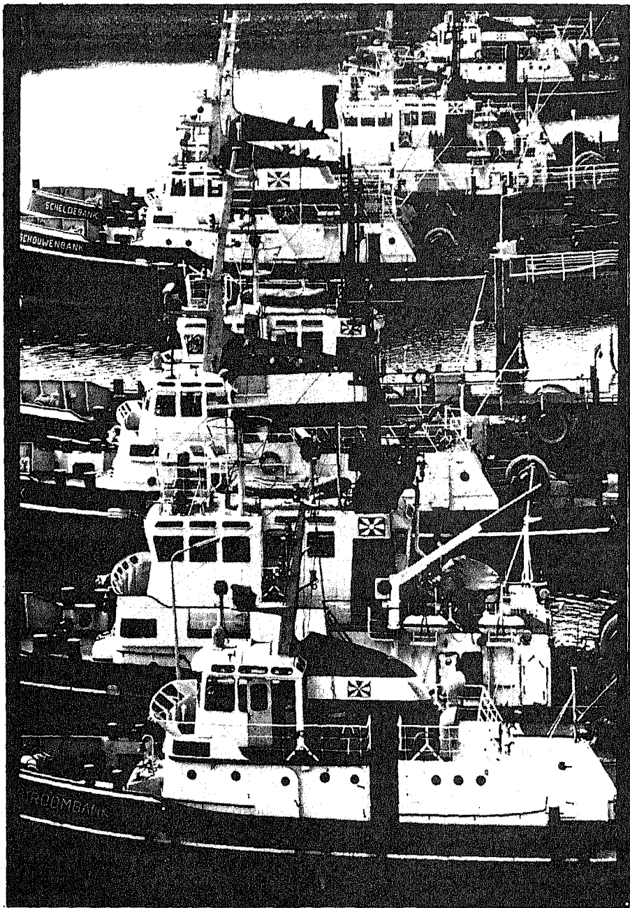
Rotterdam Schleppschiffe in Aktion ...

Die Blockade war sorgfältig und ohne großes Aufsehen vorbereitet worden, ohne daß die Kooren-Schleppschiffe etwas