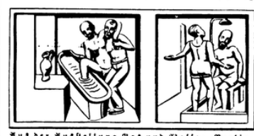
Kunstausstellung des Deutschen Reiches, Berlin Hilflos im Kampf Gesundheitsschutz des Dampfverbandes deutscher Krankenkassen, Berlin-Charlottenburg

Die Geschichte des Sozialismus und Kommunismus ist eine Geschichte der Menschheit. Sie beginnt mit den ersten Anfängen der menschlichen Zivilisation. Die Menschen haben immer versucht, ihre Lebensbedingungen zu verbessern. Sie haben immer versucht, die Ungleichheiten der Gesellschaft zu beseitigen. Sie haben immer versucht, die Gerechtigkeit herzustellen. Das ist die Geschichte des Sozialismus und Kommunismus.