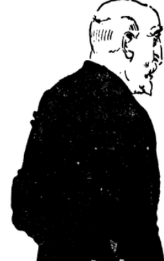
Bürgermeister Karl Seitz, Wien