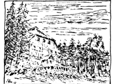
Naturfreundliche am Ahrweiler, Wahnheimer, Wahnheimer...