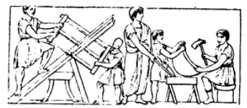
Arbeiter im Werk