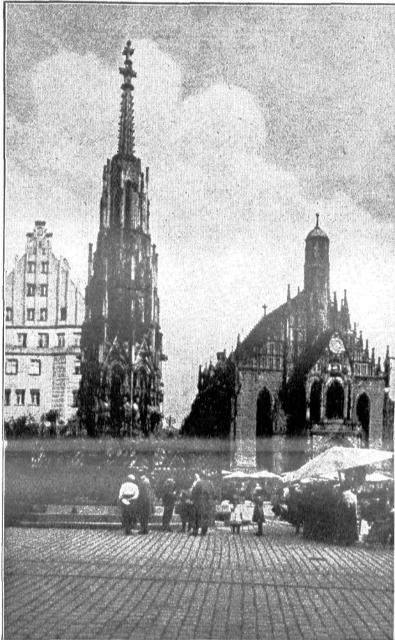
Schöner Brunnen und Frauenstraße

Diese kurzen Sätze zeigen, daß Nürnberg nicht allein vom Alter lebt und von der Vergangenheit zehrt, sondern daß die Stadt auch bewußt mit der neuzeitlichen Industrieentwicklung gleichen Schritt gehalten hat.