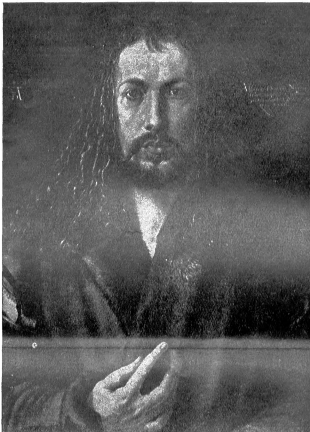
Albrecht Dürer: Selbstbildnis