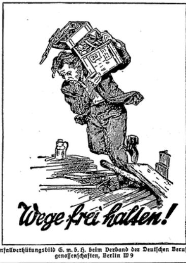
Unfallverhütungsbild G. m. b. H. beim Verband der Deutschen Berufs-genossenschaften, Berlin W 9

In der Moskauer Flugzeugfabrik geht ein Riesenflugzeug seiner Vollendung entgegen. Es ist mit acht Motoren ausgestattet, die zusammen 4000 PS entwickeln. Die Maschine kann außer der sechshöpfigen Besatzung 70 Passagiere aufnehmen. In dem Flugzeug wird ein fester Kurvenwender, eine Schnellpresse und eine Projektionsmaschine für Luftkameen installiert werden, außerdem ein Restaurant und ein Kaufhaus sowie Schlafkabinen. Die Spannweite der Tragflächen beträgt 60 Meter. Das Flugzeug soll auf den Namen des Dichters Maxim Gorki getauft werden.