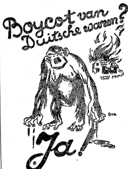
Bojkott von deutschen Waren? Ja!

Die beiden Bilder haben wir aus der holländischen Greuelpropaganda des Baugewerks entnommen; sie messen wohl besser als es Worte vermögen, daß die internationale Sozialdemokratie wie eine Seuche sich in all Dörfern Europas ausbreitet. Die blutdürstige Bestie geht ungewisselhaft die Tügel unseres Volkskanzlers. Wer die Bilder sieht und die Verhältnisse im heutigen Deutschland nicht kennt, muß glauben, daß hier nur Mord und Zerstörung herrscht. Aber selbst bekannte ehemalige marxistische Größen haben unbedrängt zugegeben, daß gerade bisher rechtlose Handarbeiter im Staate Adolf Hitler