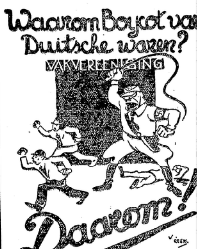
Warum Bojkott von deutschen Waren? Dankom!

funden. Wenn wir auch wissen, daß der ganze internationale Marxismus auf Lüg und Derrat aufgebaut ist, so dürfen diese Lügennachrichten des Auslandes trotzdem in ihrer Wirkung nicht unterdrückt werden. Im übrigen ist einwandfrei der Beweis erbracht, daß Anhänger der ehemaligen deutschen Sozialdemokratischen Partei die ausländische Presse mit diesen falschen Meldungen beliefern und sich damit einmündig des Hochverrats schuldig machen. Dieses hat die grenzenlose Macht der marxistischen Führer gegenüber diese Burden besonders mutig gemacht.