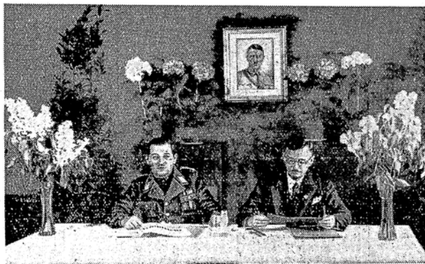
Pg. Ullmann Pg. Gutmann

Das gesamte Bundesvermögen — auch das der Bauwerkschaften — wird zentral erfaßt und bei der Deutschen Arbeiterbank festgelegt. — Einheitlicher Beitragssatz und einheitliche Unterstützungen