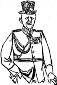
Der neue Kanzler.