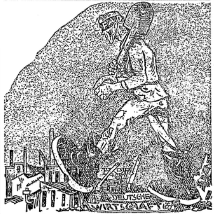
Der freiwillige Arbeitsdienst.