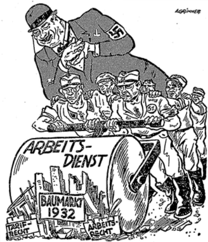
Arbeitsdienst marschiert - Bauprolet kriecht!

Krankhausbehandlung bedeutend zweckmäßiger und daher auch billiger sein, als wenn der Versicherte monatelang vielleicht noch ohne Erfolg lediglich in ärztlicher Behandlung ist. Die Entscheidung darüber, ob Krankhauspflege zu gewähren ist, liegt allein dem Kassenvorstand ob. Die gesetzliche Grundlage für die Gewährung von Krankhauspflege bildet der § 184 der Reichsversicherungsordnung. Hat die Krankenkasse den Eintritt eines Versicherten in ein Krankenhaus veranlaßt oder sich etwa nachträglich mit der Krankhauspflege einverstanden erklärt, so muß sie diese Leistung so lange gewähren, bis der Versicherte ohne Gefahr für seine Gesundheit das Krankenhaus verlassen kann oder bis die tatungsgemäße Inerstützungspflicht der Kasse abgelaufen ist. Es ist dies ein schon lange bestehender Rechtsgrundsatz. Die Kasse kann also nicht willkürlich eine einmal zugestimmte Krankhausbehandlung widerrufen. Sie hat hierzu nur dann die Möglichkeit, wenn der Versicherte durch sein Verhalten usw. die Stellung hinaussetzt. Im Gegenzug hierzu verliert der Kranke sofort seinen Anspruch auf Krankengeld und Krankentage, wenn er infolge schuldhaften Verhaltens aus dem Krankenhaus ausgewiesen ist. Hat die Krankenkasse einmal ihre Zustimmung zur Krankhauspflege gewährt, so muß sie auch alle entstehenden Nebenkosten tragen. Hierzu gehören vor allen Dingen die